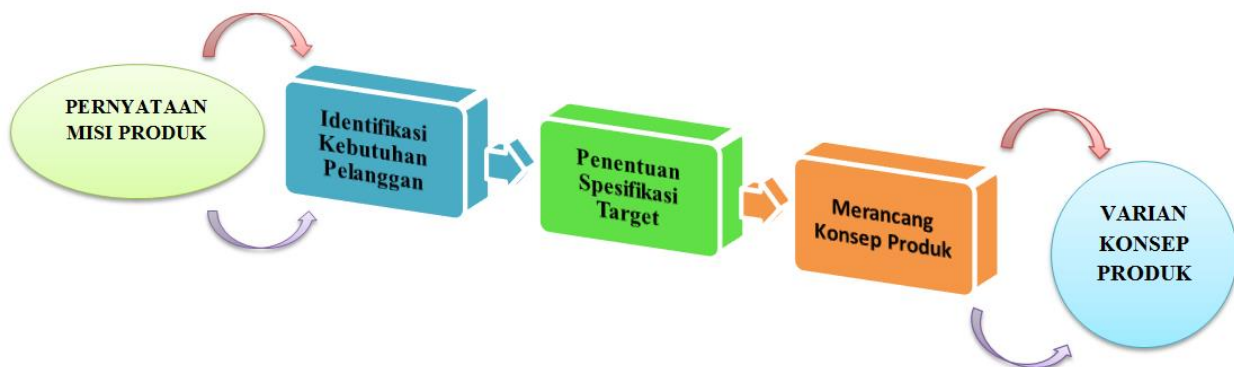
Gambar 2 Tahapan perancangan konsep

Dalam tulisan ini perancangan dan pengembangan produk fishing deck machinery yang dilakukan ada pada fase 1, yaitu: pengembangan konsep dalam tahap ini, merupakan fase yang paling panjang dan sangat menentukan produk yang akan dihasilkan nanti. Berikut tahapan-tahapan pada setiap proses perancangan konsep yang dilakukan: